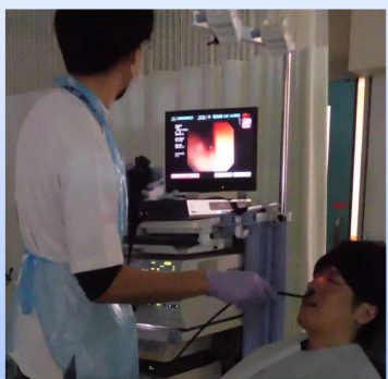
VE（嚥下内視鏡）検査場面

レントゲン装置を使用し、透視下で造影剤が含まれた食物を食べていただきます。胃の検査と似た方法で口やノドの動きを観察し、食物が食道ではなく気管に入っていないか（誤嚥していないか）確認します。2泊3日の検査入院となります。