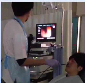
VE（嚥下内視鏡）検査場面

レントゲン装置を使用し、透視下で造影剤が含まれた食物を食べていただきます。胃の検査と似た方法で口やノドの動きを観察し、食物が食道ではなく気管に入っていないか（誤嚥していないか）確認します。2泊3日の検査入院となります。