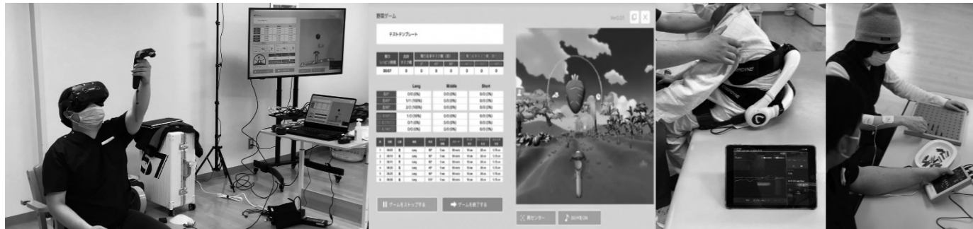
(mediVR カグラ®を使ったリハビリの様子) (実際のVR画面5つのゲームを揃えている) HAL®腰タイプ(左)と【電気刺激 DRIVE】(右)を使ったリハビリの様子

電気刺激 DRIVE（株式会社デンケン）は脳卒中などが原因で起こる手足の麻痺の回復を目的とした電気刺激装置です。「肘を伸ばしながら腕を上げる動作」や「腕を曲げて伸ばす」といった複数箇所への刺激が可能で、効率的に筋肉の収縮運動を促すことでリハビリの効果を高めることが出来ます。