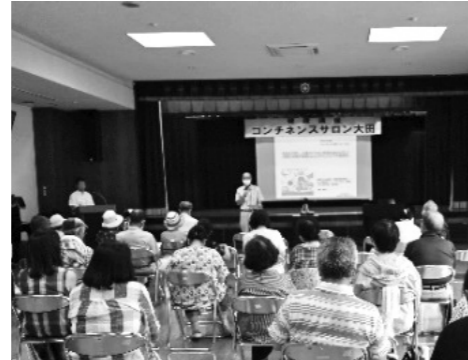
(出前講座での講話の様子)

当院の医師や看護師、各専門分野の担当者が、地域のサロンや公民館、企業、福祉施設、教育機関等に出向き健康や医療に関する内容を分かりやすくお話する出前講座を開催しております。地域の皆様との交流を通じ、当院への理解を深めていただけるような顔の見える関係づくりを目指してまいります。