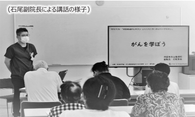
(石尾副院長による講話の様子)